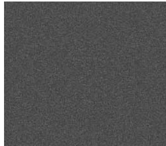
SAF-DB 703 matt